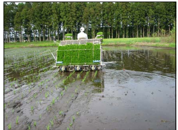
田植えの状況 不耕起の田植え機を使用 して行いました。