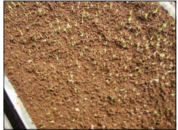
苗箱を広げるときの苗箱の状態です。 少し、芽がでてきています。