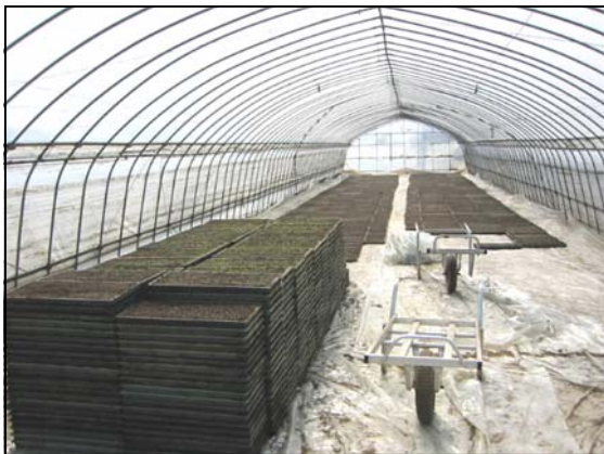
苗ひろげ これから、田植えまで苗のおともりが始まります。